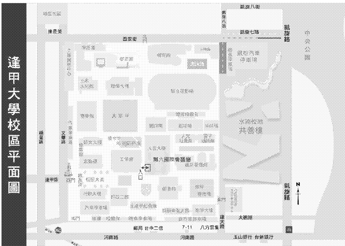
逢甲大學校區平面圖