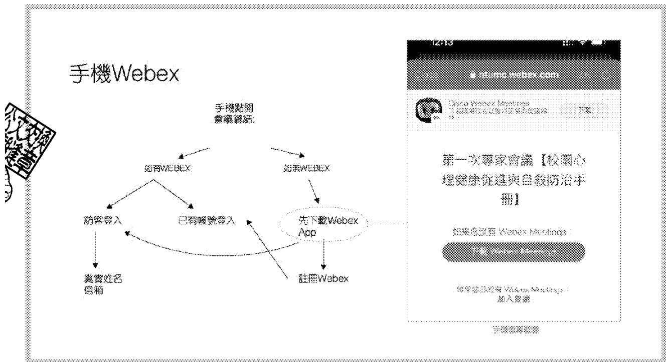
Figure 2 簡易手機版 Webex 加入會議說明。