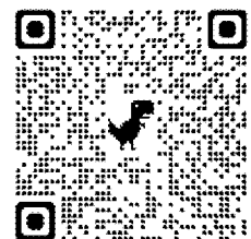
報名連結 QR Code