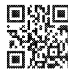
Trang web chương trình PrEP