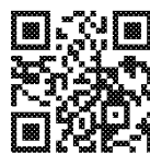
Cẩm nang gói PrEP

PrEP là thuốc dự phòng trước phơi nhiễm đã được nghiên cứu quốc tế chứng minh là có hiệu quả trong việc phòng ngừa nhiễm HIV, cần phải được bác sĩ đánh giá chỉ định trước khi sử dụng. Để biết thông tin chi tiết, vui lòng tham khảo thông tin trong link mã QR.