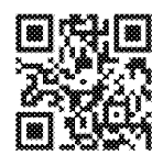
CDC giúp bạn làm quen với PrEP