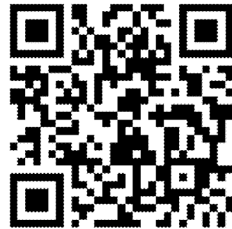
報名表單 QR CODE