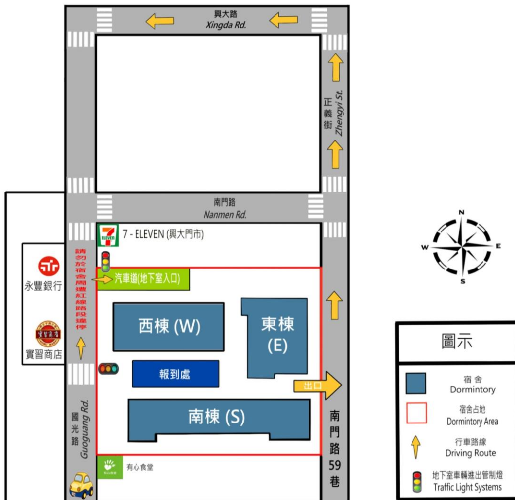
圖一、興大二村一樓行進路線圖

(二)興大二村男宿行進路線：新生家長車輛自國光路車道進入地下室，依現場人員指示卸放行李後，由後方出去左轉南門路59巷，直行後至興大路左轉，即可返回校園停放車輛。