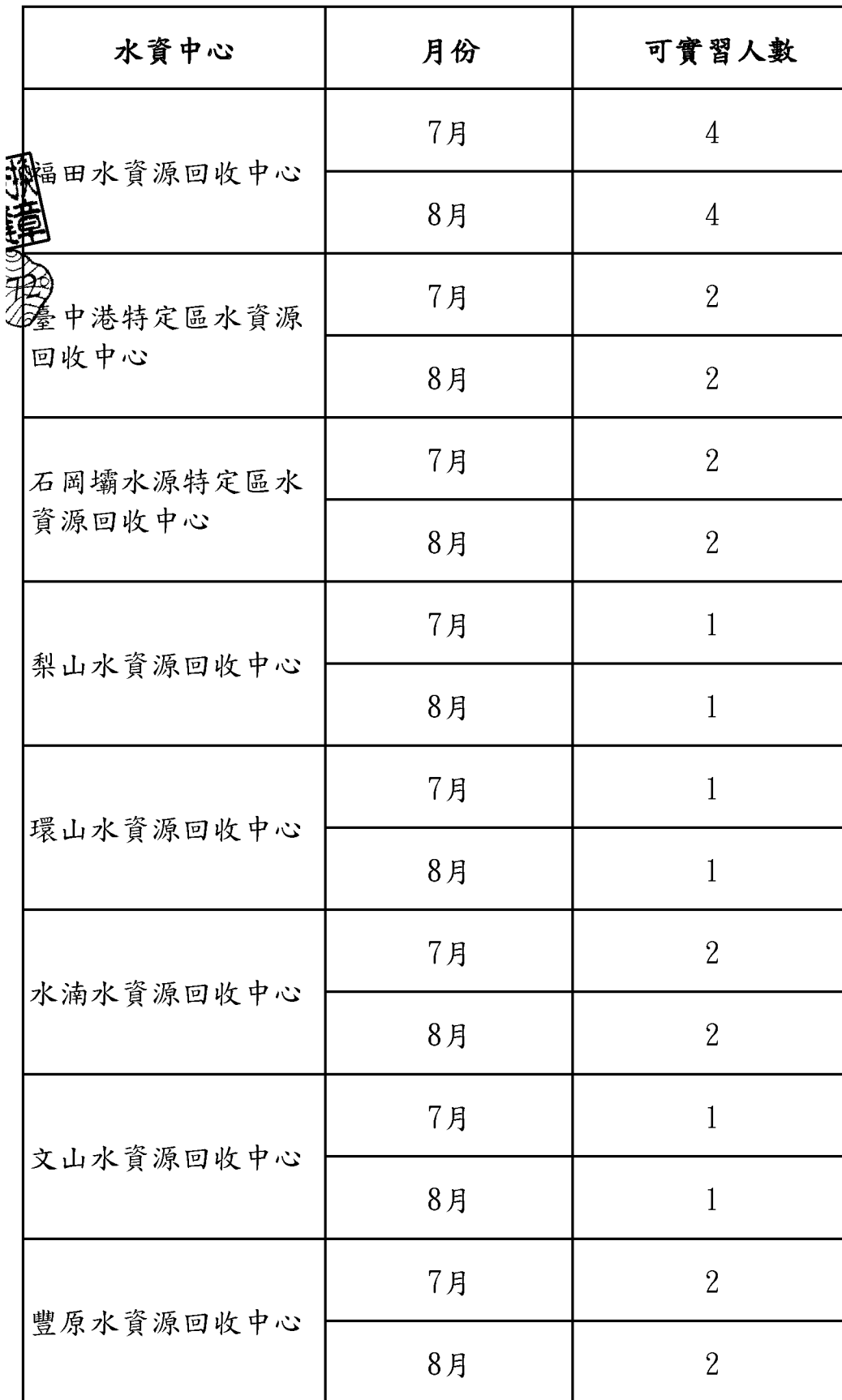
臺中市水資中心113年度暑期實習之名額彙整表