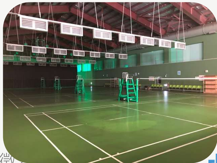
羽球場 排球場 籃球場