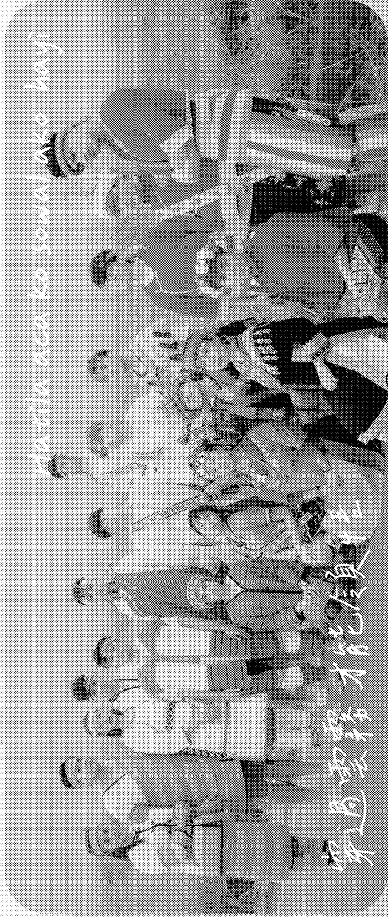
Hatila aca ko sowalako hayi