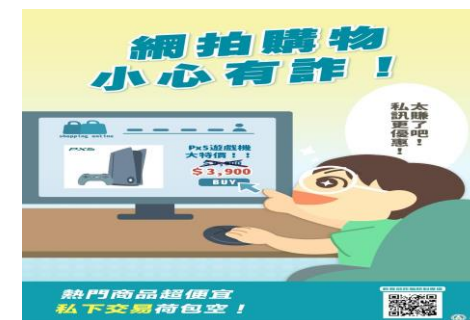
網拍購物，小心有詐