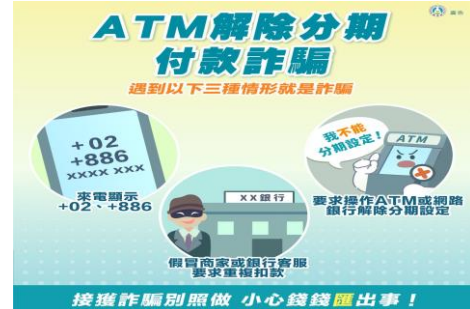
ATM 解除分期付款詐騙