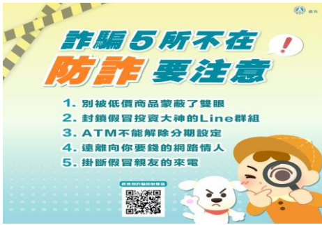
詐騙5所不在，防詐要注意