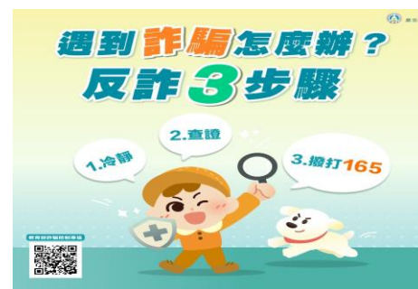
遇到詐騙怎麼辦? 反詐3步驟