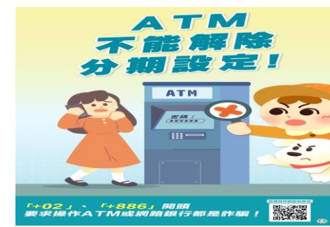
ATM 不能解除分期設定!