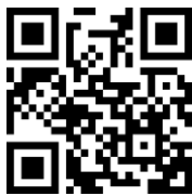
【教育部防制學生藥物濫用資源網】